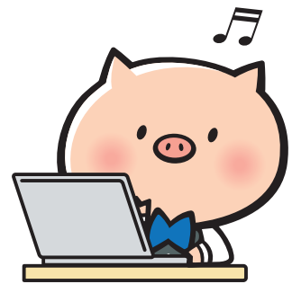
信用組合愛知商銀マスコットキャラクター ▲トントンくん