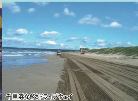
千里浜なぎさドライブウェイ