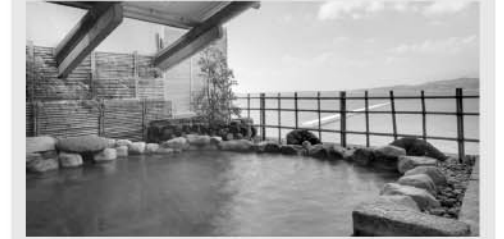
婦人用大浴場露天風呂