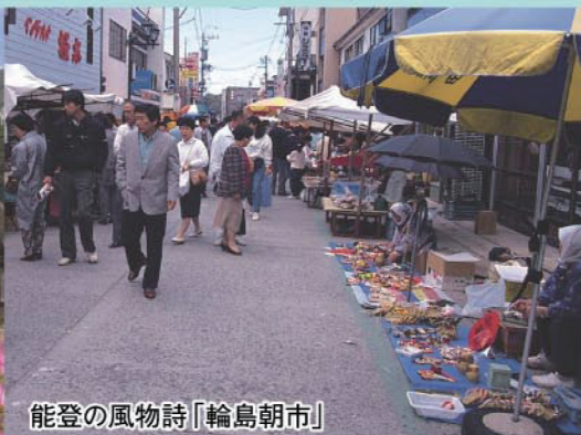
能登の風物詩「輪島朝市」