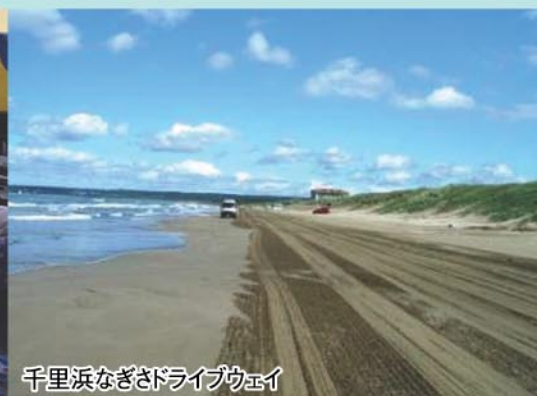
千里浜なぎさドライブウェイ