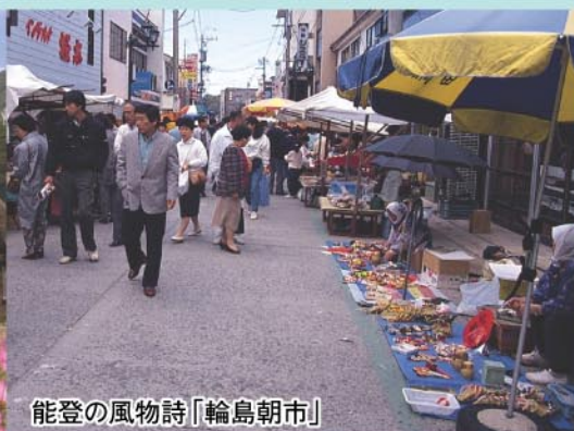
能登の風物詩「輪島朝市」