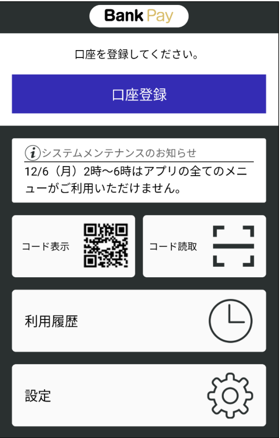
「口座登録」をタップ