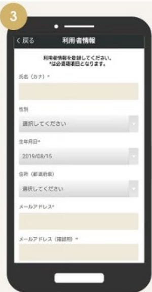
利用者情報を登録 ※1※2