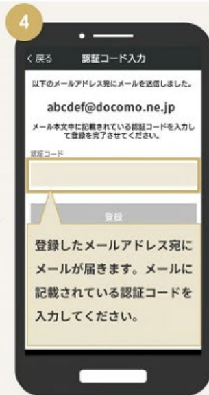
認証コードを入力