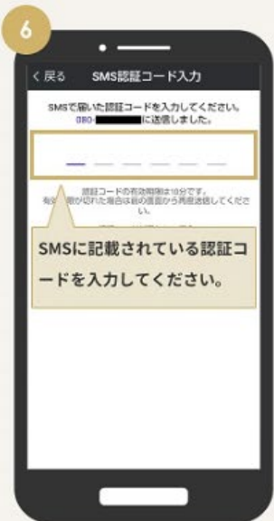
SMS認証コードを登録